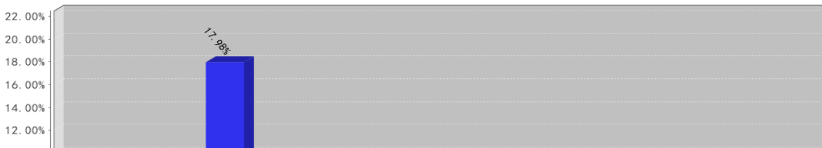
中金安心回报A类份额基金每年净值增长率与同期业绩比较基准收益率的对比图(2020年12月31日)

● 股票类资产 ● 债券类资产 ● 货币类资产 ● 其他金融资产 ● 其他非金融资产