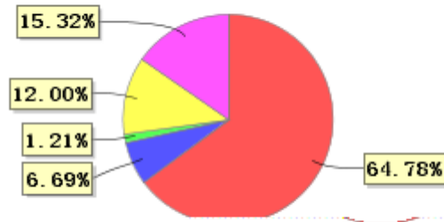
投资组合资产配置图表(2021年6月30日)