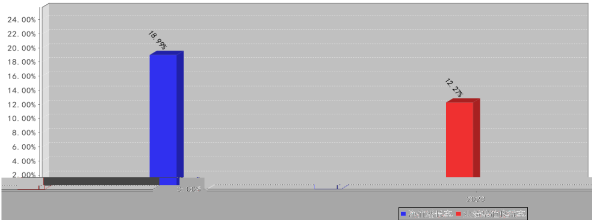
中金精选A类份额基金每年净值增长率与同期业绩比较基准收益率的对比图(2020年12月31日)

● 买入返售金融资产 ● 其他各项资产 ● 权益投资 ● 银行存款和结算备付金合计